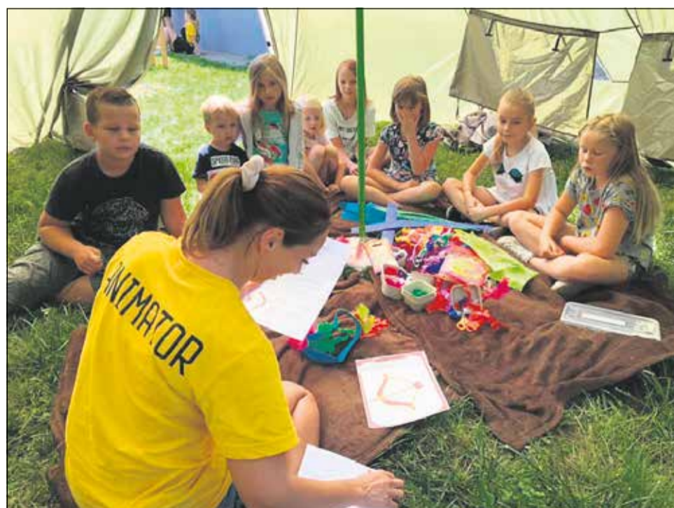
Tak wspiera NOWES