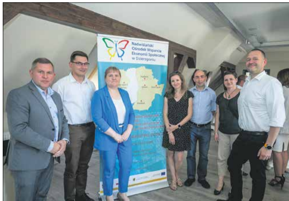
Rozmawiali o ekonomii społecznej