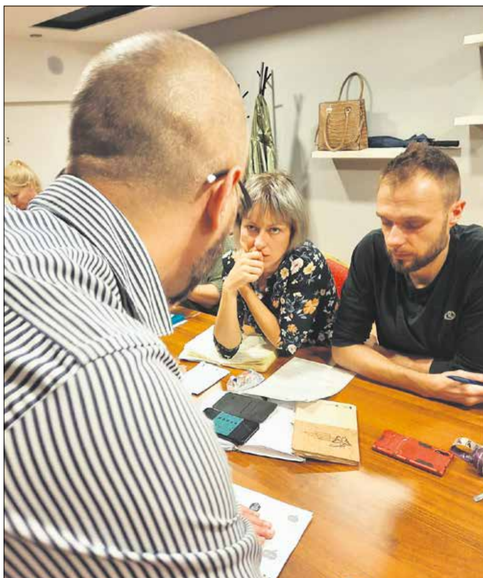
NOWES zaprasza do Szkoły Menadżera Ekonomii Społecznej

W drugiej połowie listopada odbędzie się nabór wniosków i biznesplanów do ostatniej rundy dotacyjnej w tym roku. Zainteresowane podmioty zapraszamy do zgłaszania swoich pomysłów do animatorów Nadwiślańskiego Ośrodka Wsparcia Ekonomii Społecznej. Szczegóły na stronie internetowej www.nowes.pl . W zakładce O nas znajdziecie Państwo dane kontaktowe do osób, które poinformują, w jaki sposób ubiegać się o oferowane przez NOWES wsparcie.