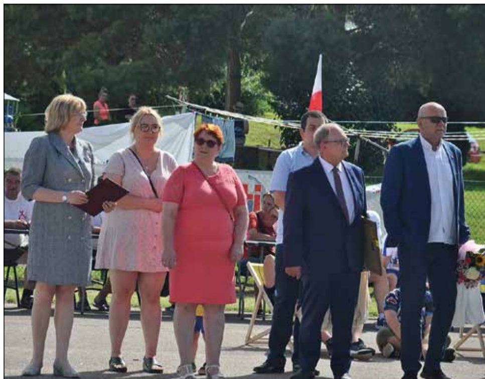
Spółdzielnia socjalna „Sercem do Ludzi” wyróżniona!

realizowana w ramach Regionalnego Programu Operacyjnego Województwa Pomorskiego na lata 2014-2020, Oś Priorytetowa 6. Integracja, Działania 6.3 Ekonomia społeczna, Poddziałanie 6.3.2 Podmioty ekonomii społecznej